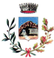
Comune di Romana