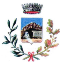
Comune di Romana