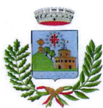
Comune di Villanova Monteleone