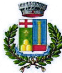
Comune di Padria