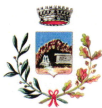
Comune di Romana